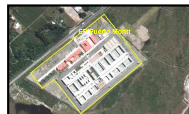
Emplazamientos Establecimientos Penitenciarios Grupo 3