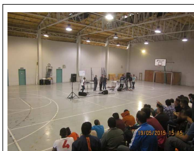
IMG. N°00 1: Gimnasio E.P. Santiago 1.

Con fecha 19 de mayo de 2015, en dependencias del Gimnasio de la Unidad Penal, se presenta banda de Hip Hop, "Tiro de Gracia", contando con la participación de 359 internos imputados.